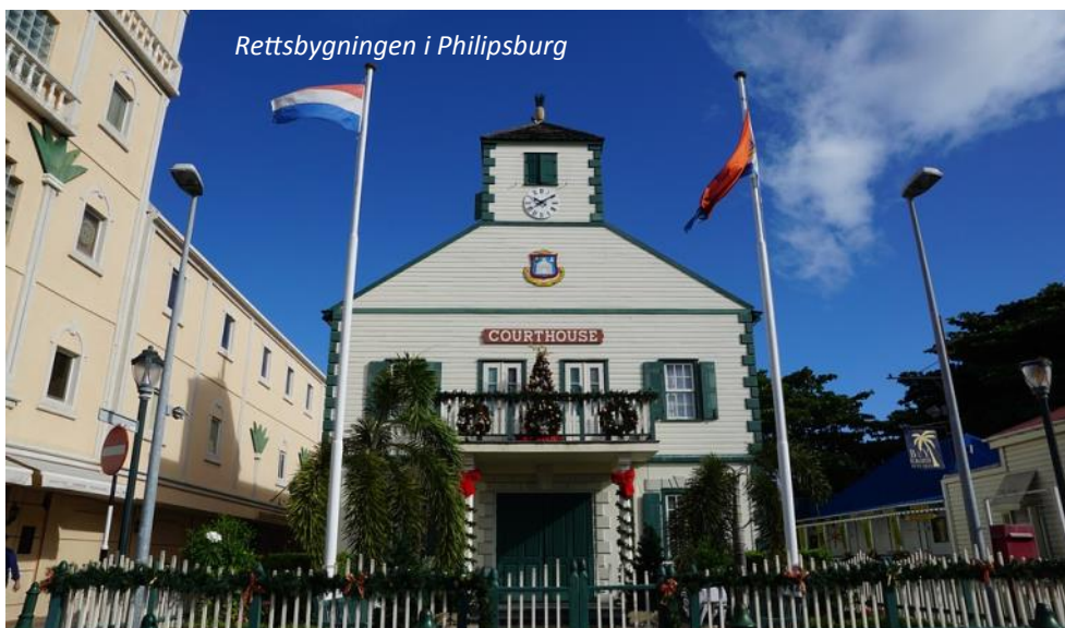
Rettsbygningen i Philipsburg

Dag 13, søndag 22. april 2018 : Fly København - Oslo Lufthavn Gardermoen, buss til hjemsted: Flyet vårt fra Miami er beregnet å lande ca kl 07.15 i København. Etter et kort opphold her, flyr vi videre allerede kl 08.10 til Oslo Lufthavn Gardermoen, med beregnet ankomst 1 time og 5 minutter senere. Vår turbuss og dyktige sjåfør venter her, klar for å ta oss sørover forbi Oslo, ut på E18 og videre mot Sørlandet. Mulighet for avstigning underveis og vi beregner å være i Kristiansand omkring kl 15.00 og de øvrige steder vestover i henhold til dette.